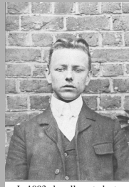
In 1903 als collegestudent