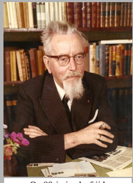
Op 80-jarige leeftijd